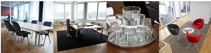
Abb. 1: Beispielfotos der Foto-Revue (Runde 2)

Wenn alle Teilnehmer einmal Gelegenheit hatten, ihre Assoziationen zu einem Foto auszusprechen, leitet der Moderator die zweite Runde ein. Der Prozess der ersten Runde wiederholt sich jetzt, allerdings werden dieses Mal ausschließlich Fotos der neuen Arbeitsumgebung gezeigt.